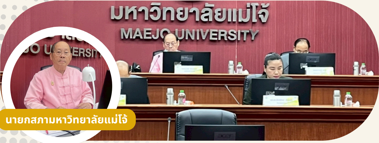
นายกสภามหาวิทยาลัยแม่โจ้